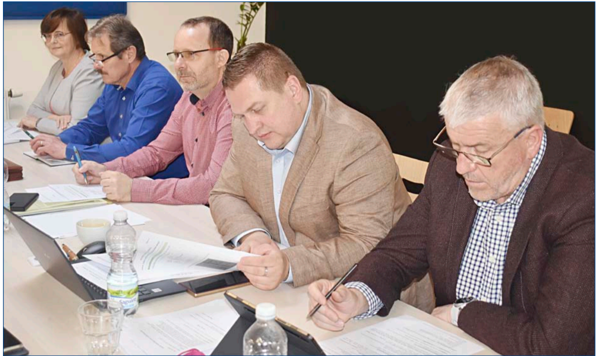
Snímek z jednání Ústředí OSŽ, které se konalo 19. dubna, pořídila Daniela Houdková