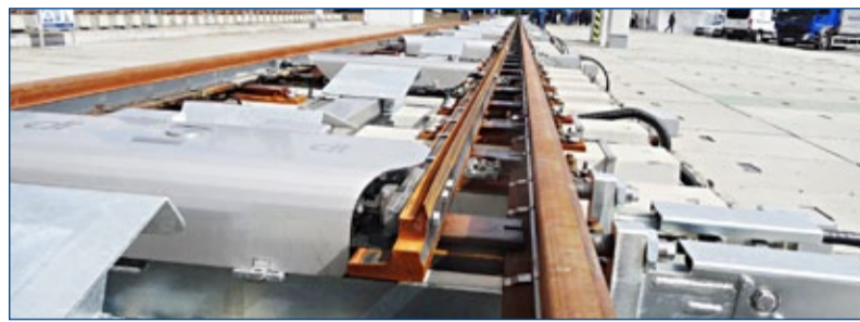
38 metrů dlouhý jazyk výhybky pro VRT