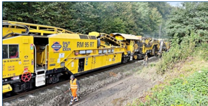
Oprava podemleté trati mezi stanicemi Děhylov–Háj ve Slezsku (trať Ostrava–Svinov–Opava–východ)