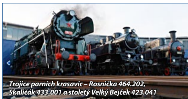
Trojice parních krasavic – Rosnička 464.202, Skaličák 433.001 a stoletý Velký Bejček 423.041