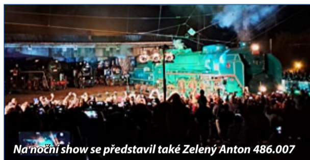
Na noční show se představil také Zelený Anton 486.007