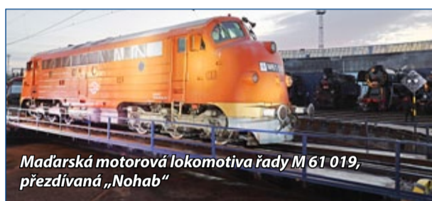
Maďarská motorová lokomotiva řady M 61 019, přezdívaná „Nohab“