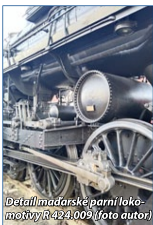
Detail maďarské parní lokomotivy R 424.009

(Pozn. red.: Jízdy na tratích s ETCS už se také řeší) Miroslav Čáslavský